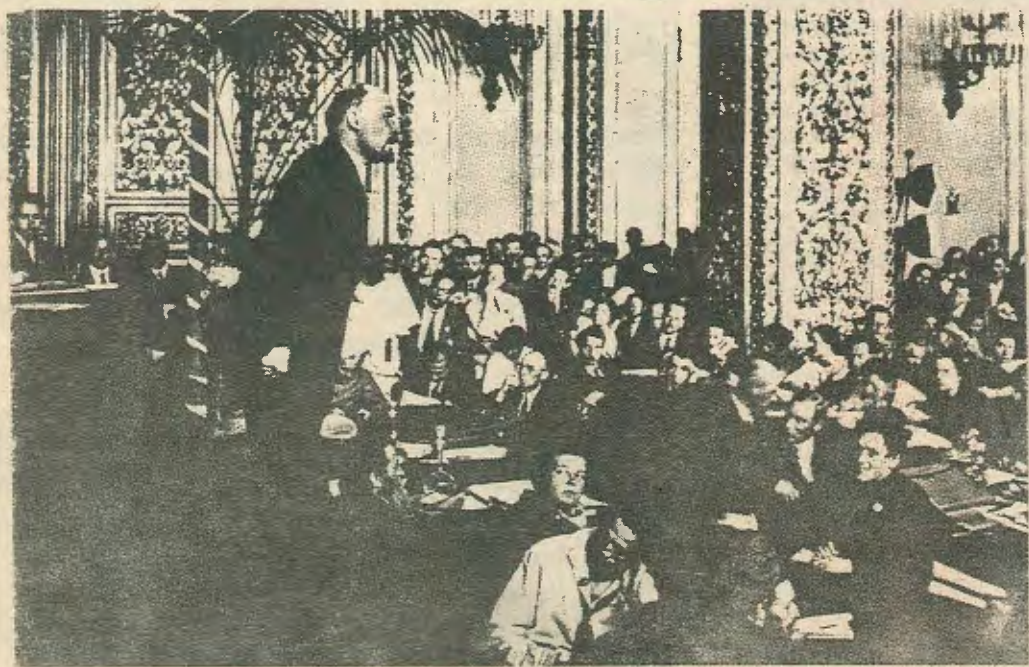
Αφιέρωμα στην 61 Επέτειο της Ρώσικης Επανάστασης σελ. 4